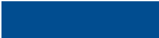
Enzianblau RAL 5010