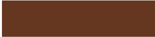
Nussbraun RAL 8011