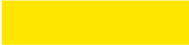
Rapsgelb RAL 1021