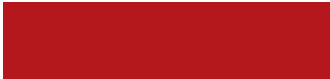
Feuerrot RAL 3000